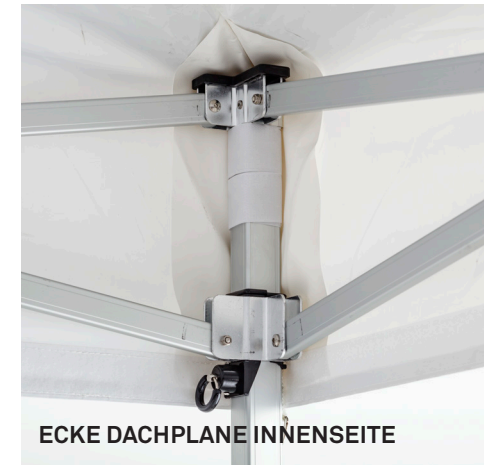
ECKE DACHPLANE INNENSEITE