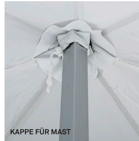
KAPPE FÜR MAST