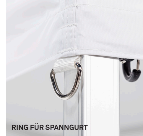
RING FÜR SPANNGURT